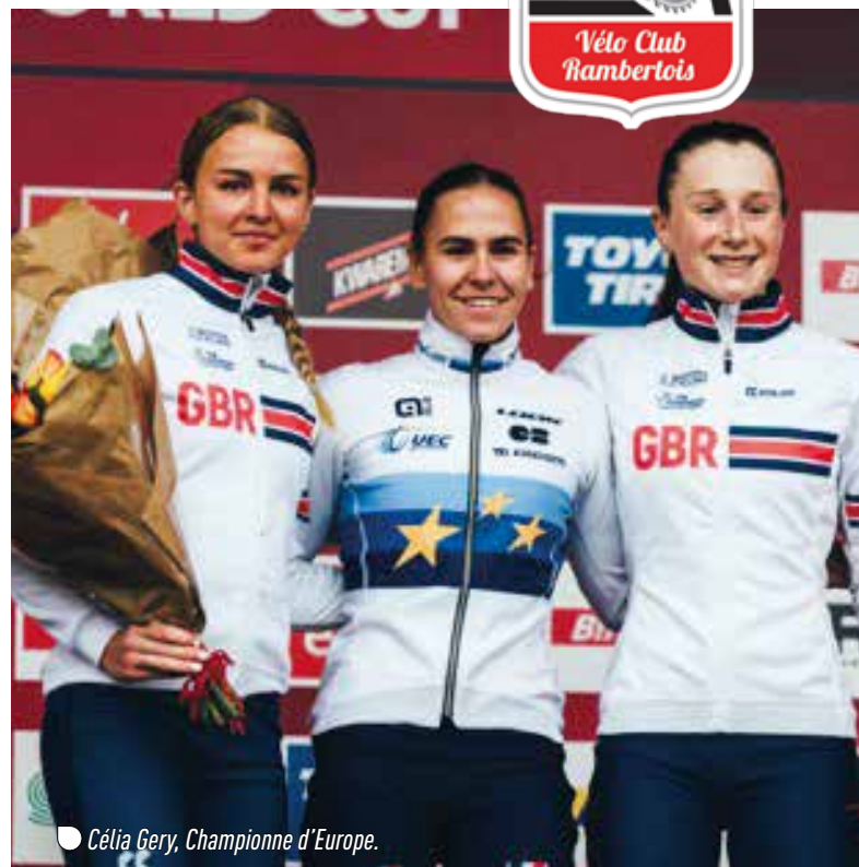
● Célia Gery, Championne d'Europe.