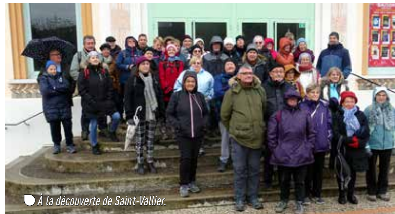
À la découverte de Saint-Vallier.

gym_saint_rambert@yahoo.com fabienne.poncery82@orange.fr