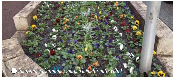
● Plantations d'automne : merci d'embellir notre ville !

Conseillère déléguée chargée de l'environnement