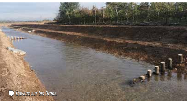
Travaux sur les Orons.

L'année 2023 vient de se terminer, la sécheresse et la longue période de canicule de l'été ont fortement perturbé l'activité halieutique en rivière. Les lâchés de truites surdensitaires n'ont pas été possibles à cause des conditions de débit et de température relevées sur Oron. La situation était un peu meilleure sur Collières, une pêche électrique de comptage réalisée début octobre l'a confirmé, 7 truites maillées et 60 truitelles de 1 à 2 ans ont été recensées sur un parcours de 100 m.